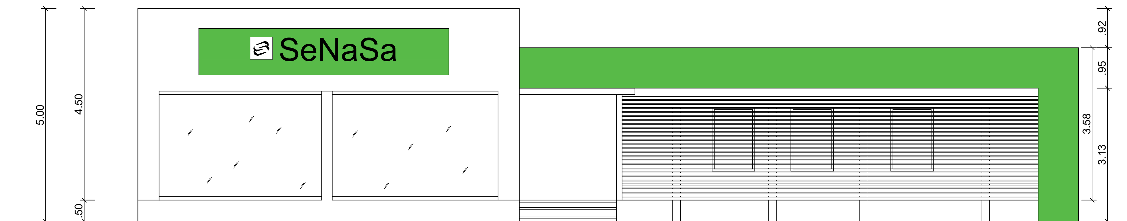
ELEVACION FRONTAL Escala: Indicada